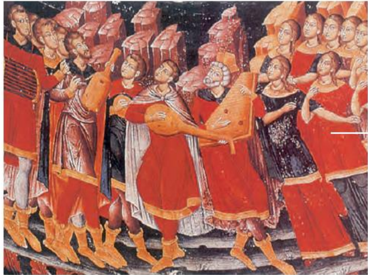
3.1. Και στις θρησκευτικές γιορτές οι Βυζαντινοί χρησιμοποιούσαν διάφορα μουσικά όργανα (Αγιογραφία, Τσεπέλοβο).

Οι Βυζαντινοί είχαν πολλές γιορτές δημόσιες, οικογενειακές και θρησκευτικές. Τιμούσαν ιδιαίτερα τους τοπικούς αγίους και μετείχαν ευχάριστα στις εκδηλώσεις λατρείας τους. Στα πανηγύρια που γίνονταν τη μέρα της γιορτής τους, μετά τη θεία λειτουργία, έτρωγαν, έπιναν, χόρευαν και τραγουδούσαν. Τους άρεσε ιδιαίτερα η μουσική και πολλοί έψελναν, τραγουδούσαν και έπαιζαν μουσικά όργανα.