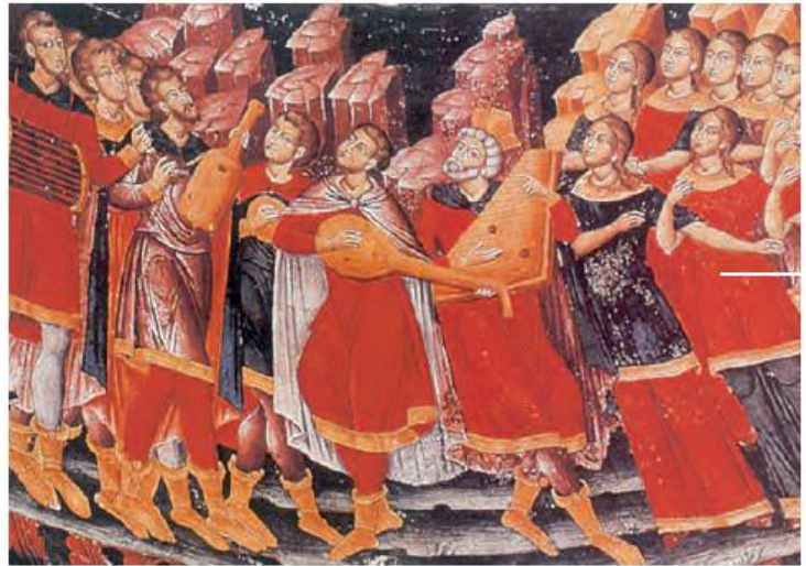
3.1. Και στις θρησκευτικές γιορτές οι Βυζαντινοί χρησιμοποιούσαν διάφορα μουσικά όργανα (Αγιογραφία, Τσπελόβο).

Οι Βυζαντινοί είχαν πολλές γιορτές δημόσιες, οικογενειακές και θρησκευτικές. Τιμούσαν ιδιαίτερα τους τοπικούς αγίους και μετείχαν ευχάριστα στις εκδηλώσεις λατρείας τους. Στα πανηγύρια που γίνονταν τη μέρα της γιορτής τους, μετά τη θεία λειτουργία, έτρωγαν, έπιναν, χόρευαν και τραγουδούσαν. Τους άρεσε ιδιαίτερα η μουσική και πολλοί έψελναν, τραγουδούσαν και έπαιζαν μουσικά όργανα.