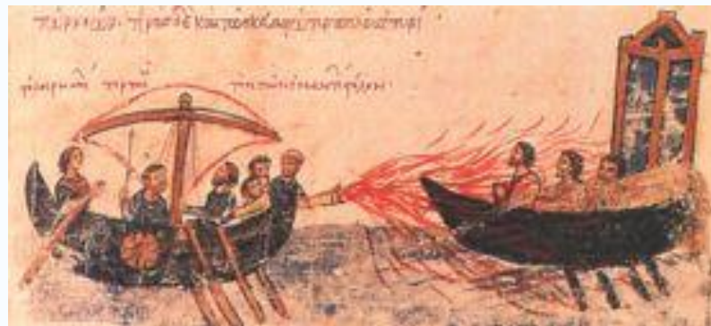
Απεικόνιση χρήσης του υγρού πυρός.

Το υγρό πυρ (επίσης Αυτόματο Πυρ , Ελληνικό Πυρ , Θαλάσσιο Πυρ , Μηδικό Λάδι και Θείον Απυρον ) επινοήθηκε ή τελειοποιήθηκε από τον Έλληνα που έμενε στη Συρία αρχιτέκτονα Καλλίνικο και η χρήση του αναφέρεται για πρώτη φορά τον 7ο μ.Χ. αιώνα εναντίον του Αραβικού στόλου που πολιορκούσε την Κωνσταντινούπολη . Υπήρξε ένα από τα φοβερότερα όπλα του μεσαίωνα και επανειλημμένα έσωσε το Βυζάντιο από εχθρικές επιθέσεις.