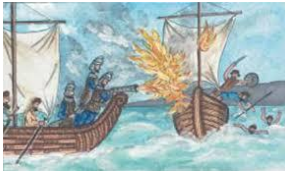
Με το «υγρό πυρ» νίκησαν τους Άραβες οι Βυζαντινοί.