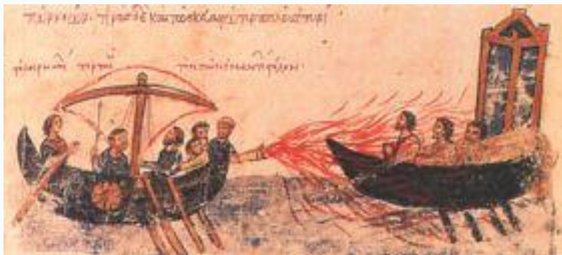
Απεικόνιση χρήσης του υγρού πυρός.

Το υγρό πυρ (επίσης Αυτόματο Πυρ , Ελληνικό Πυρ , Θαλάσσιο Πυρ , Μηδικό Λάδι και Θείον Απυρον ) επινοήθηκε ή τελειοποιήθηκε από τον Έλληνα που έμενε στη Συρία αρχιτέκτονα Καλλίνικο και η χρήση του αναφέρεται για πρώτη φορά τον 7ο μ.Χ. αιώνα εναντίον του Αραβικού στόλου που πολιορκούσε την Κωνσταντινούπολη . Υπήρξε ένα από τα φοβερότερα όπλα του μεσαίωνα και επανειλημμένα έσωσε το Βυζάντιο από εχθρικές επιθέσεις.